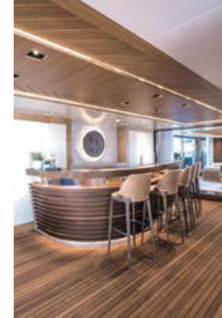
••• Бар по соседству с салоном: симфония дерева и кожи