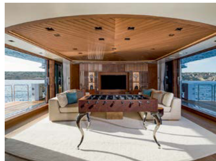
••• Когда границы стираются... Салон на главной палубе