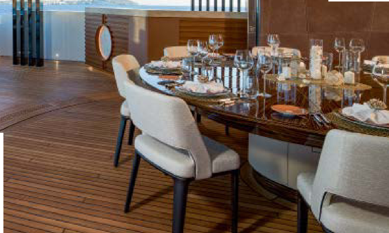
••• Когда огромные сдвижные изогнутые стеклянные двери открыты, обеденная группа на верхней палубе сливается с зоной отдыха на корме