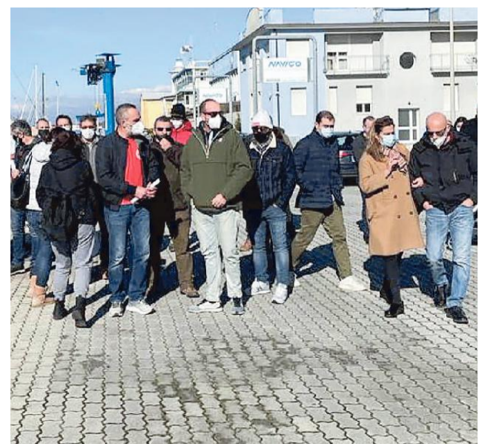
L'assemblea dei lavoratori Perini Navi ieri mattina