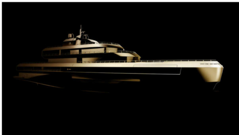
yacht giorgio armani The Italian Sea Group

Il sole che scalda la pelle, la brezza marina che sferza anche gli animi più pigri e il rumore delle onde che si infrangono sulla prua dello yacht. Di quale yacht stiamo parlando ? Ovviamente di quello firmato Giorgio Armani e The Italian Sea Group . 72 metri di puro lusso, dipinto in oro antico e dotato delle tecnologie più all'avanguardia di sempre, per il progetto che vedrà la sua completa realizzazione nel 2024.