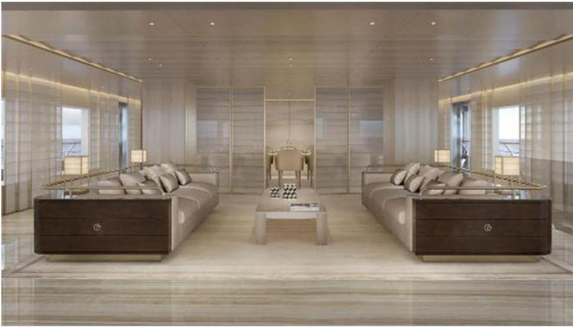
L'interno dello yacht che i cantieri navali hanno costruito e che verrà lanciato sul mercato