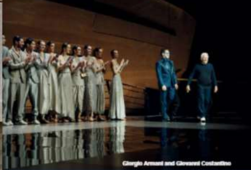
Giorgio Armani and Giovanni Costantini

With the GA 72 m, Admiral and Giorgio Armani have created more than a yacht: they have crafted a living work of art on the sea, a unique voyage into the world of elegance and creativity, with the personal signature of a legend in every corner and a discreet tribute to his memory.