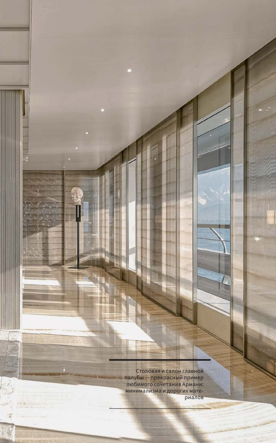
Столовая и салон главной палубы — прекрасный пример любимого сочетания Армани: минимализма и дорогих материалов